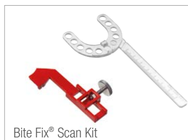
Bite Fix® Scan Kit