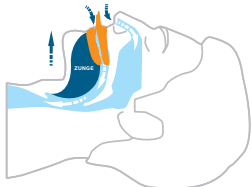
myTAP™ hält den Kiefer in einer vorderen Position und die Atemwege frei